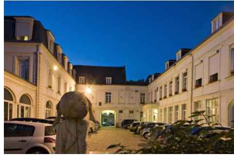
Parking privatisé pour le FJDC